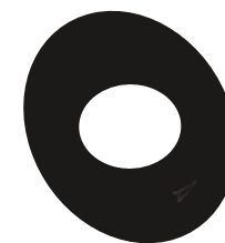
Frontale in tinta con la parete