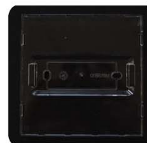
Supporto trasparente per il catarifrangente

Il catarifrangente si fissa al muro tramite un supporto trasparente e ha delle proprietà ottiche tali che gli permettono di assumere la stessa tonalità del colore della parete sulla quale è fissato.