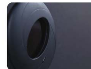
Risultato finale: Massima discrezione